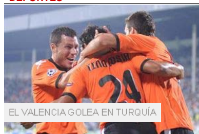
EL VALENCIA GOLEA EN TURQUÍA